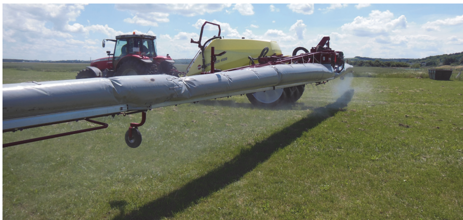
Aplikace přípravku na ochranu rostlin za použití systému podpory vzduchem s cílem omezit úlet

Pokud jsou předpovídaný vydatné srážky, neměla by se aplikace přípravků provádět. Obzvláště je nutné věnovat pozornost oblastem náchylným k úniku přípravků do podzemních a povrchových vod (vzhledem k jejich svažitosti, hloubce a složení půdy, popraskání půdy a blízkosti citlivých oblastí s vysokým stupněm ochrany vody). Vždy je třeba řídit se pokyny na etiketě přípravku nebo radou odborně způsobilé osoby ohledně konkrétních použití přípravků, pokud je aplikace závislá na úzkém časovém období. Stejně tak by měly být brány v úvahu srážky, které jsou předpovídaný na dobu bezprostředně po aplikaci přípravků.